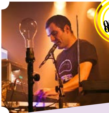
BRAIN DAMAGE Dub / Reggae