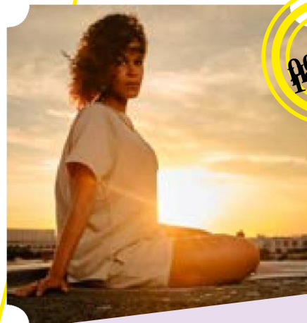
ALMÄ MANGO Hip-hop / Reggae